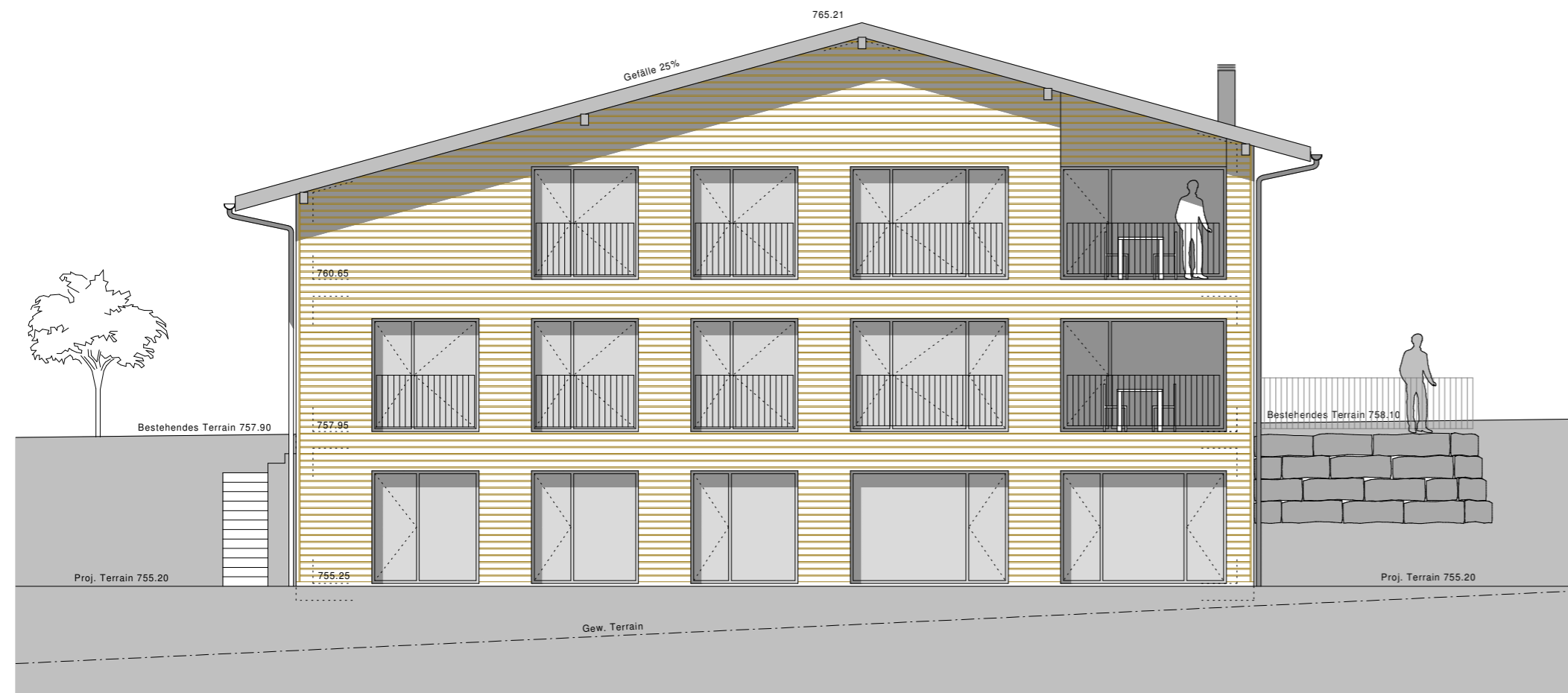
Nord- West Fassade