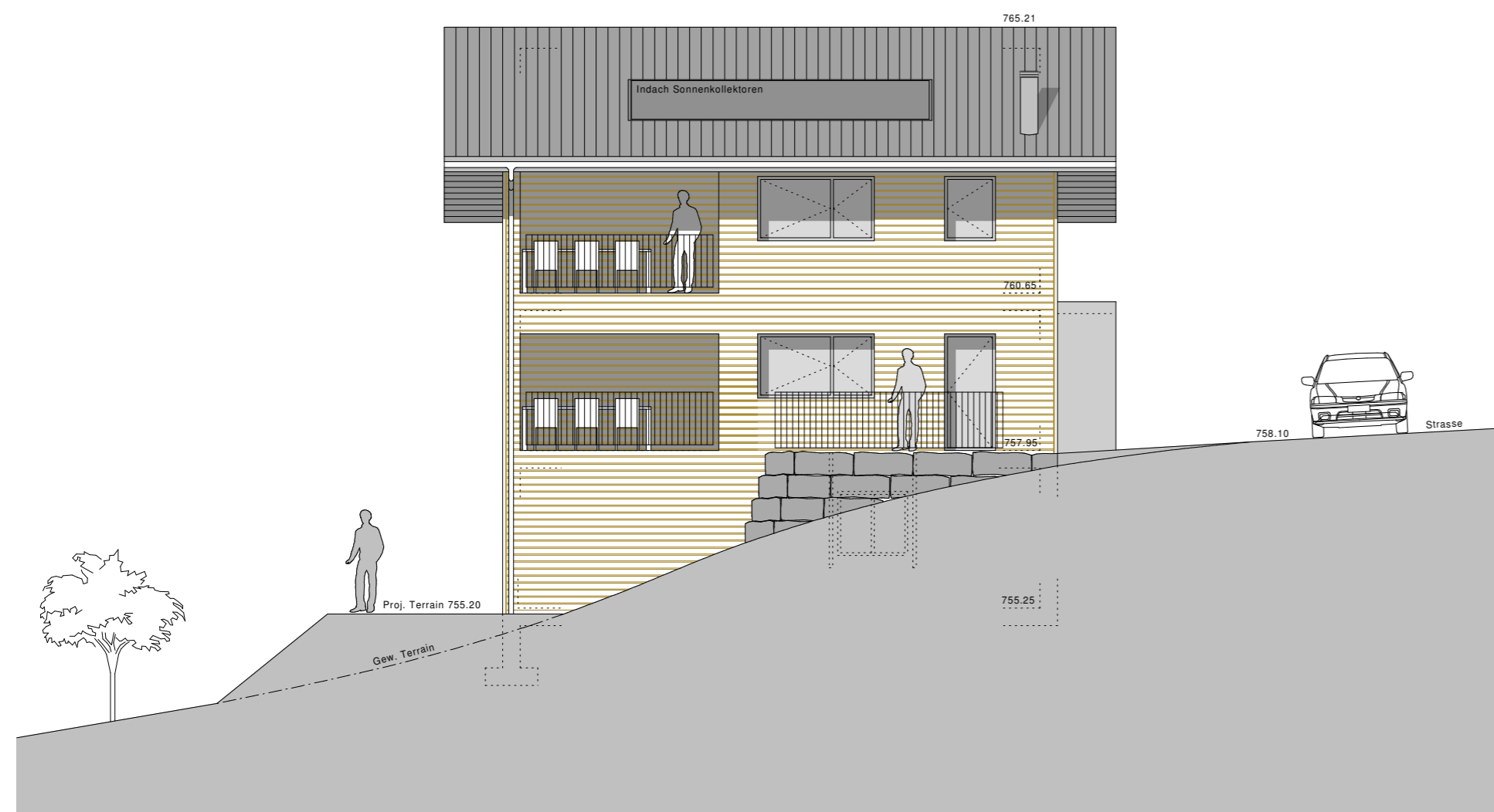
Süd- West Fassade